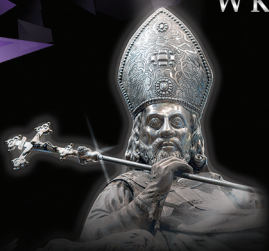
Relikwiarz św. Wojciecha